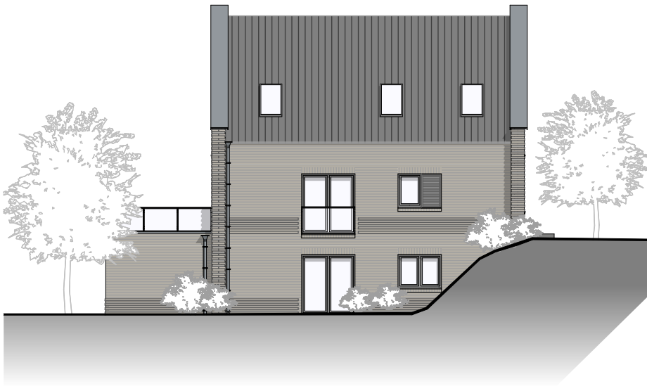
Ansicht von Norden