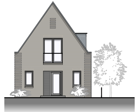
Ansicht von Westen